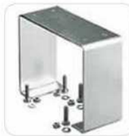
Base de anclaje