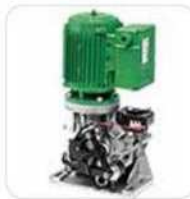
Motorreductor vertical sin capó